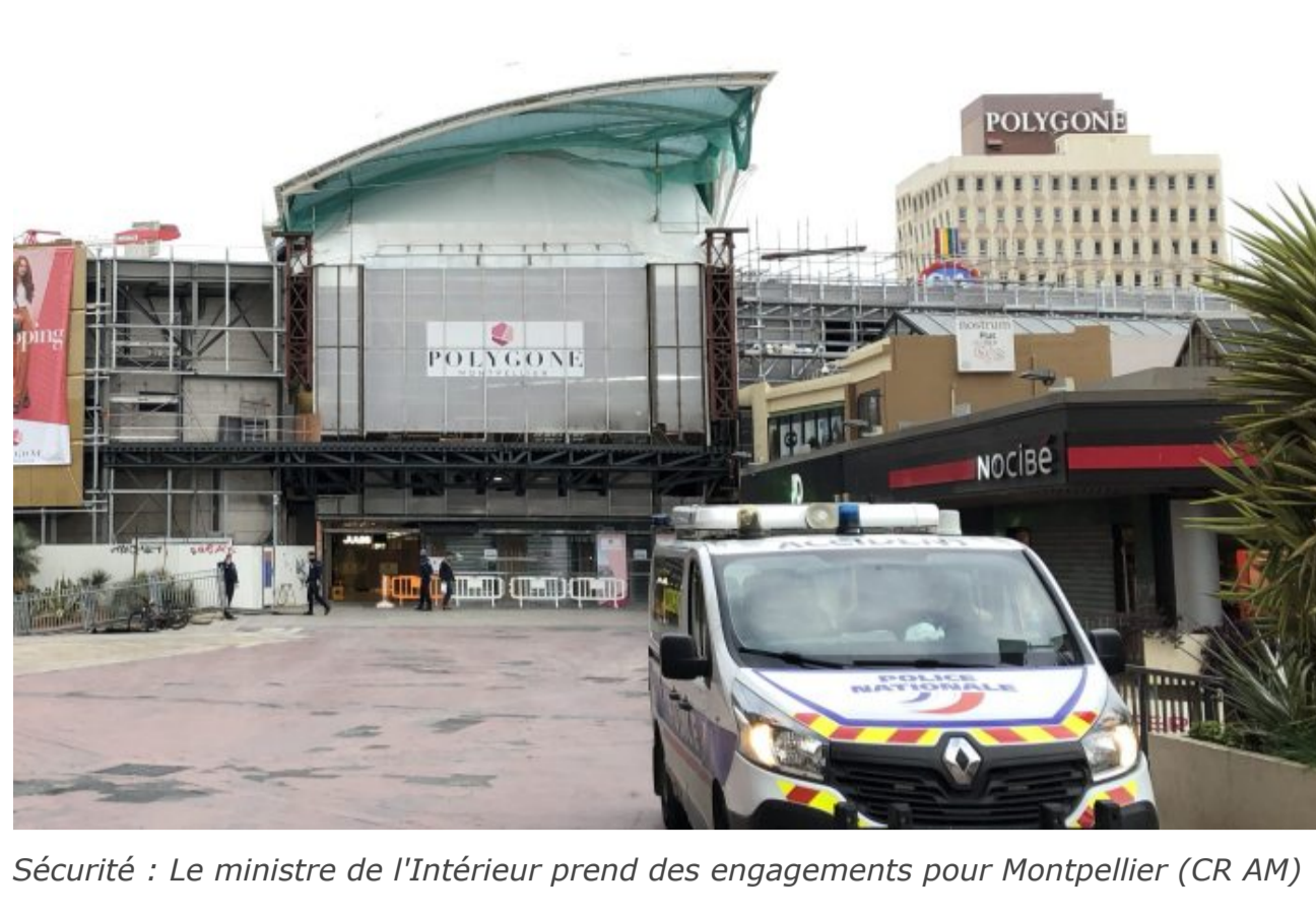
Sécurité : Le ministre de l'Intérieur prend des engagements pour Montpellier (CR AM)

Mis à jour, mercr. 30 sept. 2020 à 17h30